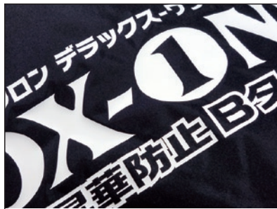
撥水生地へのマーキングが可能です。